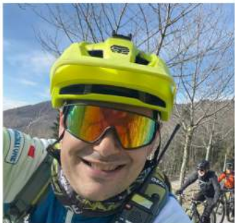
PAOLO EMANUELE ROSSI